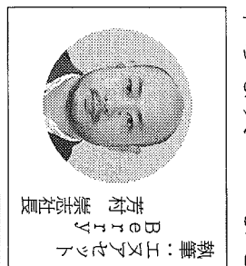
執筆：エヌアゼント Betty 斉藤 崇徳社長