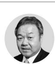
執筆：新都市総合管理株式会社 右手 康登社長

「1」と同じように分析して、長所短所を明確に把握し、特徴を把握します。分析は、この市場分析の目的は、オーナーの利益の最大化を目的として、現状把握、原因追求、対策立案、実施のサイクルを繰り返すことで、最終的にオーナーの利益の最大化を実現することです。